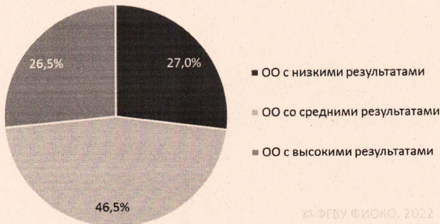
Рисунок 1. Распределение ОО по результатам (общероссийская выборка, 2021 г.)

При этом надо помнить, что образовательные результаты — это только один из показателей эффективности школы. Успешна ли школа в вопросах воспитания, профориентации? Зная ответы на эти вопросы, можно предположить, как работа школы сказывается на благополучии будущих выпускников.